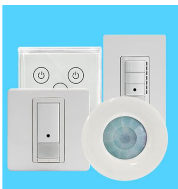
物联中心开关系列产品